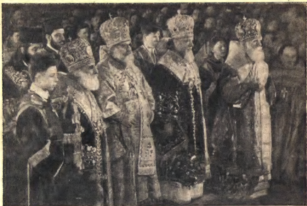
Четыре патриарха за Божественной литургией 4 февраля (слева направо): Антиохийский, Александрийский, Московский и Грузинский]

радостных знамений единства и общения Церквей, составляющих Единую Святую Соборную и Апостольскую Церковь.